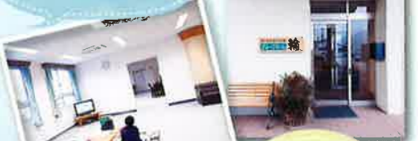
グループホーム輪 定員9名