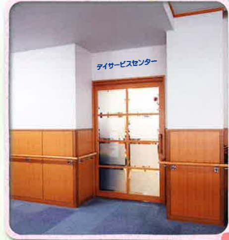
デイサービスセンター